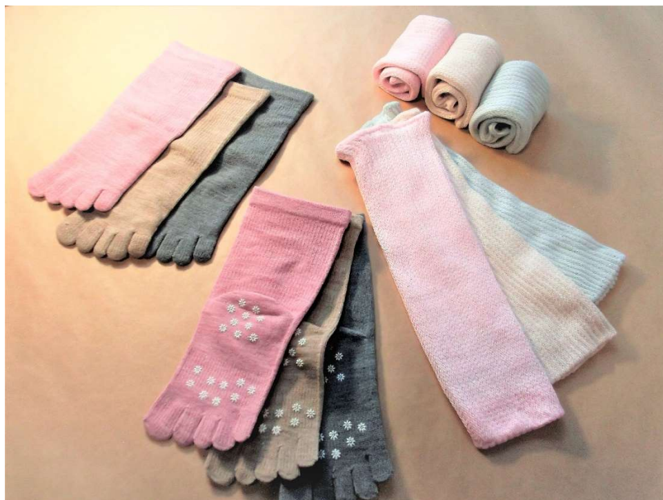
▲「《ユニユルク》ONE SIDE シリーズ」の製品写真

《ユニユルク》公式 web ページ http://www.sydecas.jp/uniulk/